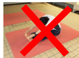
プール内ストレッチマット